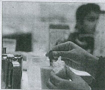
Un centre obert del Raval, a Barcelona, on algunes famílies sense recursos van a esmorzar