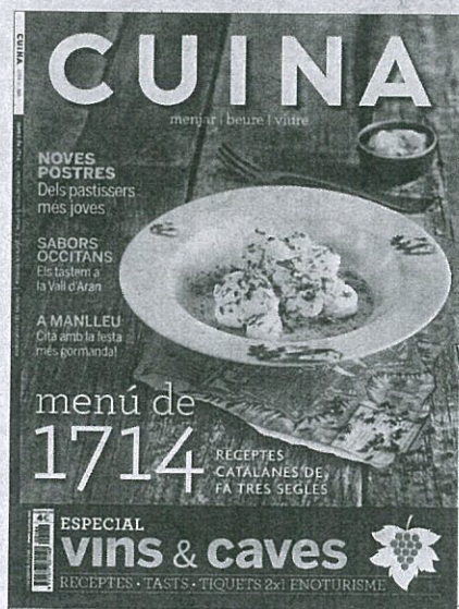
La portada de la revista 'Cuina' d'aquest setembre

La revista també dona idees per cuinar aquest fruit, com a acompanyant de plats dolços, però també salats, com carns i peixos. A més a més, l'edició de setembre del Cuina arriba amb una nova promo-